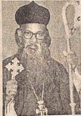
സഖറിയാസ് മാർ ദിവന്നാസിയോസ് ഓർമ്മ ജൂലൈ 7